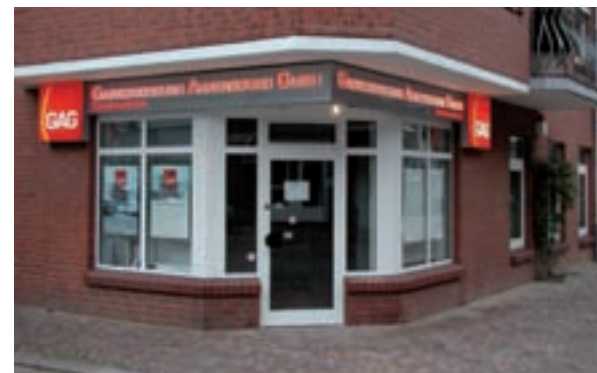
Das GAG-Kundenzentrum im Herzen von Ahrensburg.